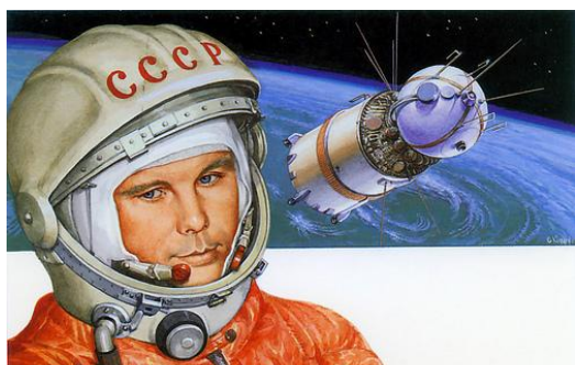
Youri Gagarine et sa capsule Vostok

Les Soviétiques, pour réaliser cet exploit, ont transformé un missile en lanceur spatial afin de propulser le spoutnik dans l'espace.