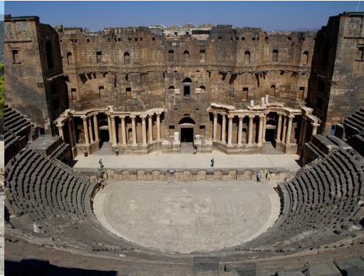
Le théâtre grec

La salle est composée d'un parterre et de baignoires (loges séparées les unes des autres par une cloison basse) et de balcons incluant des loges sur plusieurs étages. Les places du public sont conçues pour voir et pour être vu.